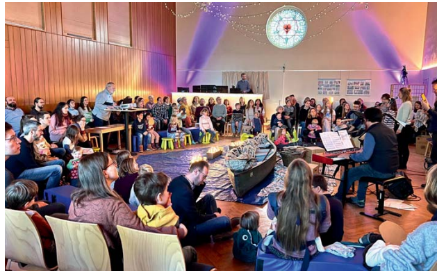
Familiengottesdienst mit viel Gesang im Januar