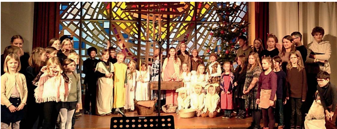
Krippenspiel 2025 - Kinderchor erstmals bewährt