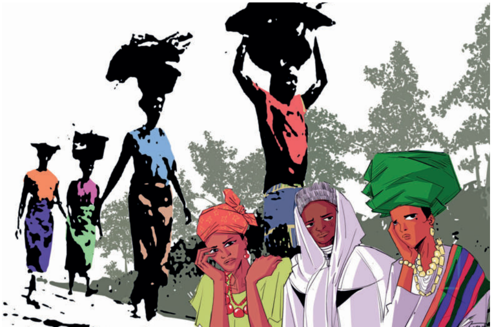
„Rest for the weary“ © WGT-Internationales Komitee / Gift Amarachi Ottah

In Nigeria werden Lasten von Männern, Kindern, vor allem aber von Frauen auf dem Kopf transportiert. Doch es gibt auch unsichtbare Lasten wie Armut und Gewalt. Das facettenreiche Land ist geprägt von sozialen, ethnischen und religiösen Spannungen. Islamistische Terrorgruppen wie Boko Haram verbreiten Angst und Schrecken. Immer wieder liest man von gewaltsamen Entführungen junger Mädchen direkt aus der Schule.