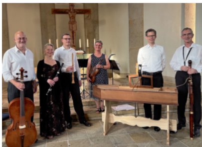
Das Ensemble »con brio«