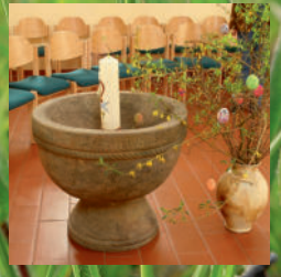
Die kleinen Bilder zeigen: Kirche Göschwitz (o.l.), Orgel in Oelnitz (o.r.), Orgel in Rothenstein (u.l.) und den Taufstein der Kirche Jägersdorf.