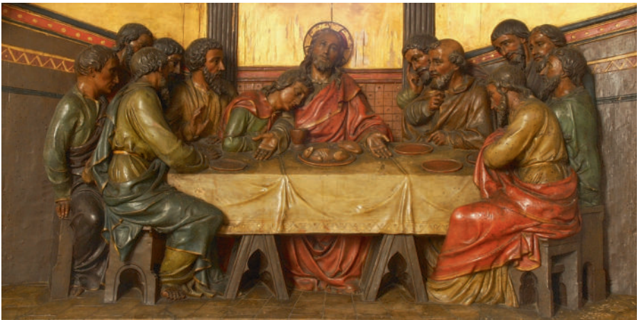
Abendmahlsdarstellung in der Kirche Rothenstein